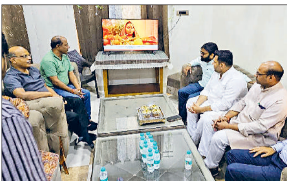
सोनीपत। मन की बात कार्यक्रम सुनते हुए विधायक साथ में अन्य।

हैं, ऐसे में उन्हें स्वदेशी अनुकूल विचारों को जन-जन तक पहुंचाना चाहिए। रविवार को सहकारिता मंत्री डॉ अरविंद शर्मा के वार्ड 11 स्थित बृथ संख्या 92 पर शिव मंदिर पहुंचे तथा प्रधानमंत्री नरेंद्र मोदी के मन की बात कार्यक्रम के 127वें संस्करण को भाजपा पदाधिकारियों व आमजन के साथ सुनने पहुंचे थे। इसके उपरांत उन्होंने प्रबुद्धजन सम्मेलन को संबोधित किया। कैबिनेट मंत्री डॉ अरविंद शर्मा ने कहा कि प्रधानमंत्री नरेंद्र मोदी के नेतृत्व की