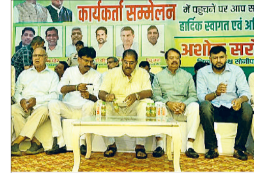
राई। जिला स्तरीय कार्यक्रम में जजपा सुप्रीमो अजय चौटाला व और पार्टी के अन्य वरिष्ठ नेता।