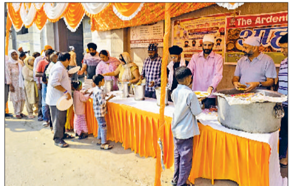
सोनीपत। लोगों को भोजन वितरित करते वलब के पदाधिकारी एवं सदस्यगण।