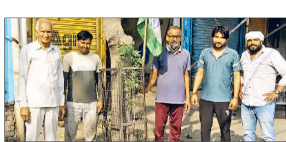
गोहाणा। पुराने पौधों के ट्री गाडों को व्यवस्थित करते संगठन के सदस्य।

समाज कल्याण संगठन ने गोहाणा को ग्रीन सिटी बनाने के अपने साप्ताहिक अभियान में रविवार को नीम, पिलखन, चक्रेसिया और पापड़ी के 16 पौधे रोपे। पौधरोपण महम मार्ग के साथ फुटपाथ की खाली जगह में किया गया। संगठन ने गोहाणा को ग्रीन सिटी बनाने के लिए गोद ले रखा है और पिछले करीब डेढ़ दशक से साप्ताहिक पौधारोपण अभियान चलाया जा रहा है।