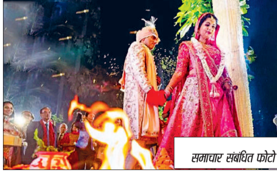
समाचार संबंधित फोटो

देवोत्थान एकादशी के दिन मंदिरों में विशेष पूजा-अर्चना के साथ भगवान विष्णु और तुलसी माता का विवाह संपन्न कराया जाएगा