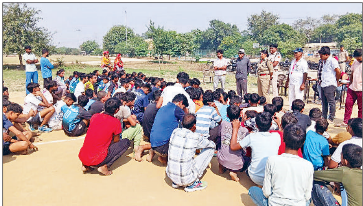
सोनीपत। खिलाड़ियों को जागरूक करते एसीपी।