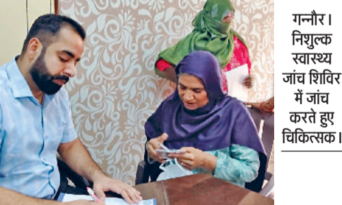
गन्वौर। निःशुल्क स्वास्थ्य जांच शिविर में जांच करते हुए चिकित्सक।