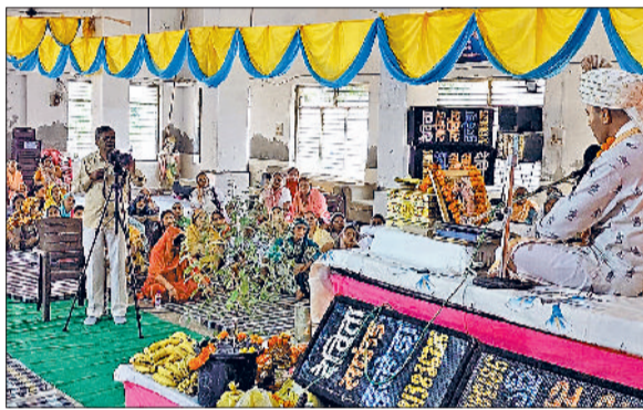
खरखौदा। भागवत कथा में वाचक व उपस्थित श्रौता।