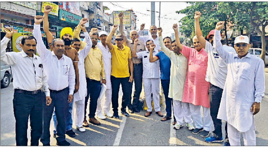
सोनीपत। टोल बूथों के खिलाफ विरोध प्रदर्शन करते संघ के पदाधिकारी एवं सदस्यगण।