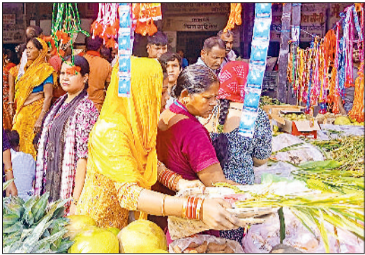
हरिभूमि न्यूज सोनीपत

चार दिनों तक चलने वाले सूर्य उपासना के महान पर्व छठ का दूसरा दिन रविवार को पूरे जिले में आस्था और भक्ति के रंग में डबा रहा। इस दिन श्रद्धालुओं ने खरना का पर्व मनाते हुए 36 घंटे के निर्जला उपवास की शुरुआत की। पूर्वांचल मूल के परिवारों के साथ-साथ स्थानीय लोगों ने भी बड़ी श्रद्धा और अनुशासन के साथ परंपराओं का पालन किया। खरना के दिन व्रती महिलाओं ने सुबह स्नान कर स्वच्छ वस्त्र धारण किए और पूरे दिन निराहार रहकर शाम के समय मिट्टी के चूल्हे पर साठी के चावल, गुड़ की खीर और रोटी का प्रसाद तैयार किया। सूर्य भगवान की पूजा के पश्चात उपवास रखने वाले श्रद्धालुओं ने प्रसाद ग्रहण किया और इसे घर-परिवार तथा पड़ोसियों के बीच वितरित किया। खरना को छठ पर्व का शुद्धिकरण दिवस माना जाता है, जिसे लोहड़ा भी कहा जाता है। धार्मिक मान्यता के अनुसार, छठ माता को सूर्य देव की बहन माना जाता है। पुराणों में वर्णन मिलता है कि माता कात्यायनी, जो देवी दुर्गा के छठे स्वरूप हैं, वही छठ माता के रूप में पूजी जाती हैं। छठ पर्व को संतान प्राप्ति और पारिवारिक कल्याण के लिए मनाया जाता है। यह पर्व न केवल पूर्वांचल बल्कि हरियाणा और उत्तर भारत के कई हिस्सों में लोक आस्था का प्रतीक बन चुका है, जहां हर वर्ष श्रद्धालु अपनी अटूट भक्ति के साथ छठ मड़या की साधना में लीन दिखाई देते हैं।